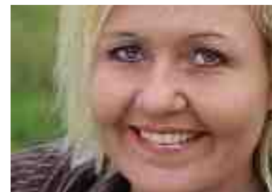
Transportminister Carina Christensen: "Risikoen og det økonomiske ansvar skal følges ad."

"Men alting har en pris. Der er intet odøst i at tjene penge, men risikoen og det økonomiske ansvar skal følges ad. Infrastruktur er samfundsøkon-