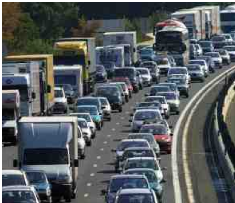
Dansk Erhverv efterlyser penge til forundersøgelser af trængselsproblemerne i trafikken.

Indien er samtidig et kontrasternes land med mange udfordringer, ikke mindst med den store fattigdom og analfabetismen. Den indiske tro på fremtiden er til gengæld stor, og det er svært ikke at blive påvirket af indernes optimisme. Der er stadig mange tiggere, men det er ikke en tigger-økonomi længere - nu er det en tiger-økonomi.