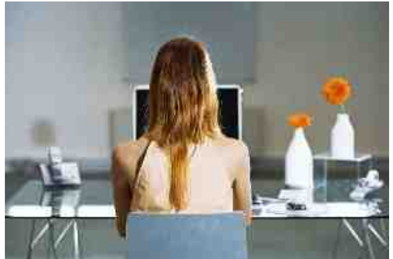
Designerens rolle er at forbedre eksisterende produkter og processer. Design tager udgangspunkt i et behov og en løsning, og er ikke æstetik for æstetikens skyld, som for eksempel kunst.

Nøglen til innovation handler altså også om at afdække brugernes ikke-erkendte behov.