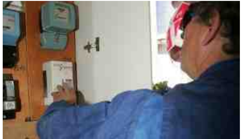
Ifølge Sikkerhedsstyrelsen har 30 % af de eksisterende installationer HFI-afbrydere, der er i så dårlig stand, at de skal udskiftes.

I sådanne tilfælde kan der opnås en tidsbegrænset dispensation. Forudsætningen er, at man fremlægger en plan for, hvordan man vil sikre sine installationer