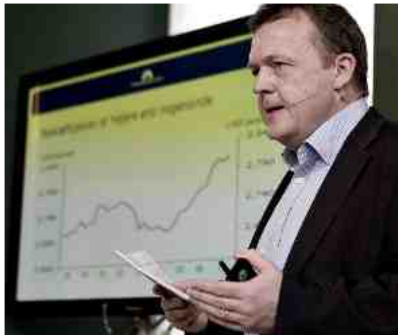
Finansminister Lars Løkke Rasmussen fremlagde regeringens forslag til finanslov for 2008. Dansk Erhverv er enig i den overordnede politik om at bremse væksten i de offentlige udgifter, men påtaler også forslaget sociale slagside.

"Det vil koste en række medborgere muligheden for at komme ind på arbejdsmarkedet. Jeg synes, det er en afgørende hæmsko, som regeringen burde have set i øjnene, inden den fremsatte sådan et forslag."