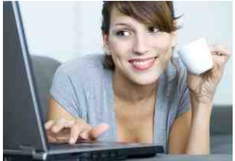
Danskerne fortryder sjældent deres indkøb på nettet.

Til gengæld ligger danske forbrugere på tredjepladsen sammen med de britiske med 22 % over klager til en virksomhed inden for det sidste år: ”Det skyldes, at det godt kan betale sig at klage. Danske virksomheder er