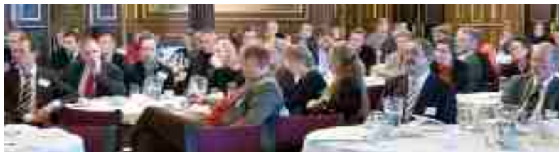
OPP-konferencen, der blev holdt i Dansk Erhvervs domicil, Børsen i København, havde foruden indlægsholdere og politikere over hundrede deltagere.

OPP-projekter er i reglen skruet sammen, så den private investor overdrager aktivet til det offentlige efter et antal år. Skatterådet har omkring statens første OPP-projekt, Rigsarkivet, skullet tage stilling til, om man kan udskyde ejerskabet i 30